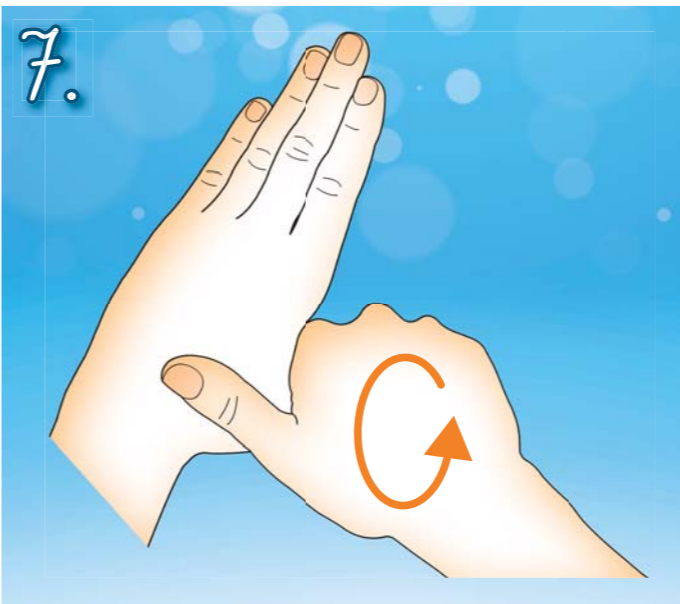
7. Třete krouživým pohybem levý palec v sevřené pravé dlani. Pak ruce vyměňte.