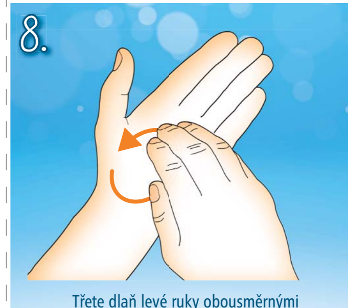
8. Třete dlaň levé ruky obousměrnými krouživými pohyby sevřených prstů pravé ruky. Pak ruce vyměňte.