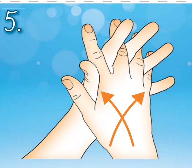
5. Dejte ruce k sobě dlaněmi. Zaklesněte prsty. Třete dlaněmi o sebe ze strany na stranu.