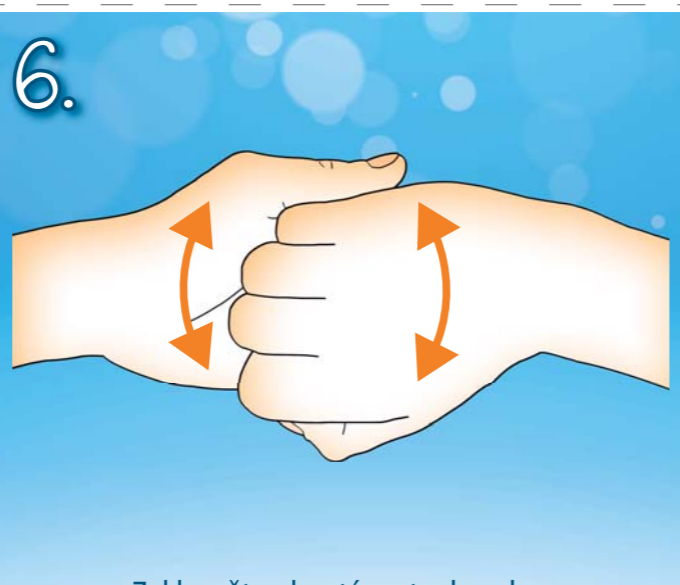
6. Zaklesněte ohnuté prsty do sebe. Třete hřbet prstů pravé ruky o dlaň ruky levé a naopak.