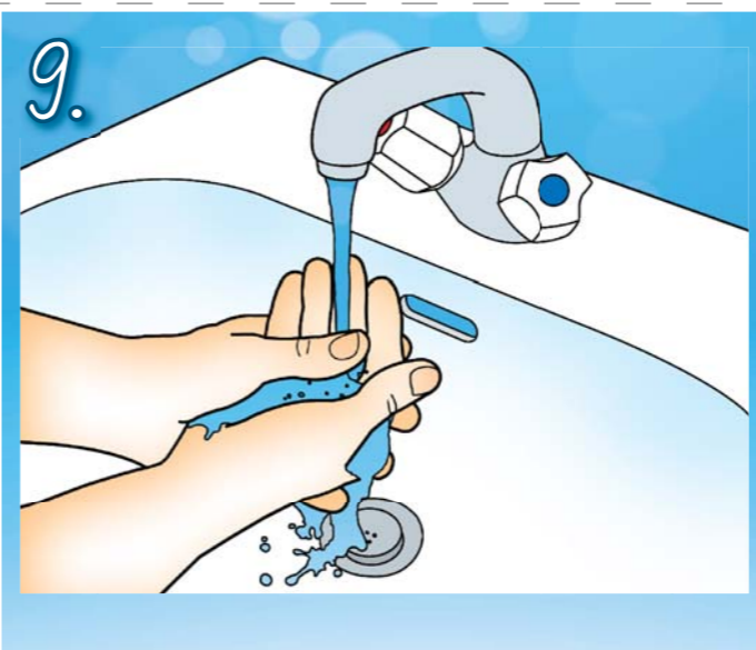
9. Opláchněte ruce pod tekoucí vodou.