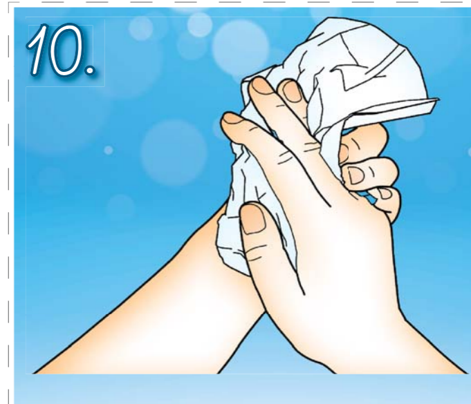
10. Ruce si pečlivě osušte. Jednorázový ručník použijte k zastavení kohoutku.