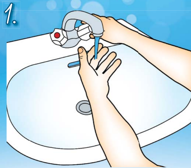
1. Navlhčete si ruce pod tekoucí vodou.