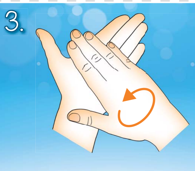
3. Třete dlaní o dlaň krouživým pohybem.